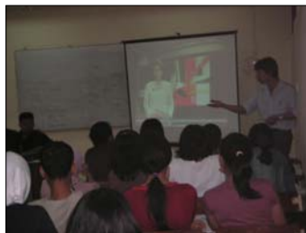
'How to visualize Crime Stories'; Dosen Tamu Kriminologi UI; doc. SBM

Yang lebih mengganggu adalah program-program berita tersebut diberi judul yang menurut saya dibuat-buat. Pemilihan slot penayangan juga pada siang hari, sekitar menjelang hingga tengah hari. Ada tiga hal mengapa pengelola usaha televisi melakukan hal ini. Pertama, mereka sangat sadar bahwa televisi merupakan sumber utama hiburan rata-rata bangsa kita. Kedua, tengah hari ada jam yang tepat untuk menonton televisi bagi masyarakat pekerja. Ketiga adalah hukum supply and demand .