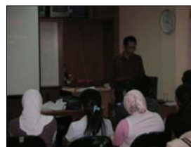
SBM Short Course; doc. SBM