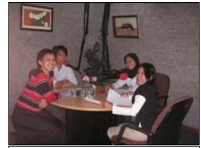
Talkshow SBM di Country Station