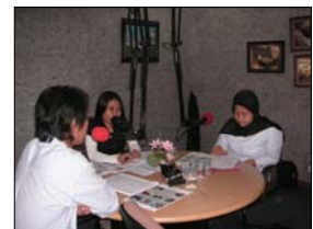
Talkshow SBM di Country Station ; doc. SBM