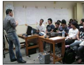
SBM Short Course; doc. SBM