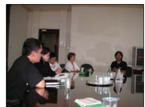
Kunjungan ke Metro TV