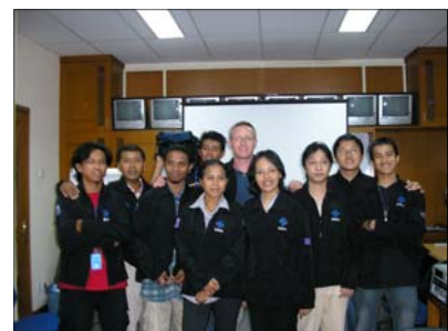
Siswa Kamera Editing Mei 2006