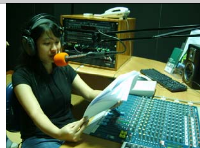
Praktek di ruang MCR Radio, kelas radio Desember 2006