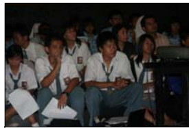
Peserta Talkshow CIVED