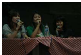
AB Three — Talkshow CIVED; doc. SBM