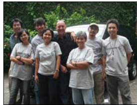
SBM Team; doc. SBM