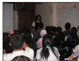
SBM Short Course; doc. SBM