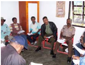
Diskusi Perdamaian, Hari Perdamaian Internasional 2006

Kantor PBI di Wamena melaksanakan dua program, yaitu program Pelayanan Perlindungan termasuk Pendampingan Perlindungan Internasional dan Pendidikan Perdamaian Partisipatif. Pada khususnya, PBI akan berfokus pada program Pendidikan Perdamaian Partisipatif di Wamena serta melaksanakan pelbagai kegiatan serupa yang sudah dilakukan dengan sukses di Jayapura: pembukaan sebuah perpustakaan perdamaian yang menyediakan pelbagai sumber bacaan dan audio visual tentang budaya damai, pertunjukan film yang berkaitan dengan topik perdamaian, dan membangun inisiatif lokal dalam bentuk dialog antara komunitas setempat berkaitan dengan budaya damai dalam bentuk diskusi perdamaian. Berdasarkan prinsip pembangunan kapasitas lokal, PBI bekerja bersama organisasi partner setempat yang menaruh minat dan bergerak dalam bidang pembangunan perdamaian. Program Pendampingan Perlindungan Internasional sekarang dilaksanakan atas permohonan klien-klien PBI. Selain itu Tim PBI di Wamena sudah mensosialisasikan rencana PBI di kabupaten Jayawijaya dan kabupaten Yahukimo.