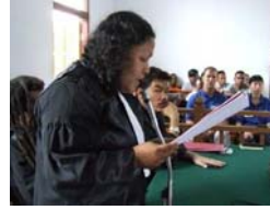
2. Pemantauan keadaan anggota-anggota organisasi mitra kami waktu mereka membela klien mereka di Pengadilan Abepura.