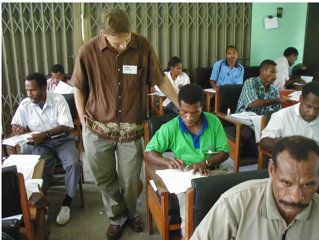
Figure 1. Participants of Mother Tongue Translation Workshop