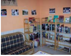
1. Perpustakaan Perdamaian di kantor PBI Pendidikan Perdamaian Partisipatif di Jayapura

Tim Jayapura telah memperluas perpustakaan perdamaian sampai 500 buku-buku, laporan-laporan dan materi mengenai pembangunan perdamaian, transformasi konflik secara damai, gender, hukum dan pendidikan perdamaian. Selain itu ada juga media interaktif tentang aksi tanpa kekerasan dan topik lain yang berkaitan dengan perdamaian di Bahasa Indonesia dan di Bahasa Inggris.